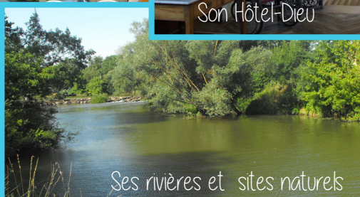
Ses rivières et sites naturels