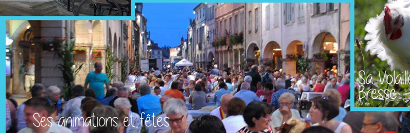
Ses animations et fêtes

Situé sur la Seille, rivière canalisée de 40 km avec 4 écluses manuelles