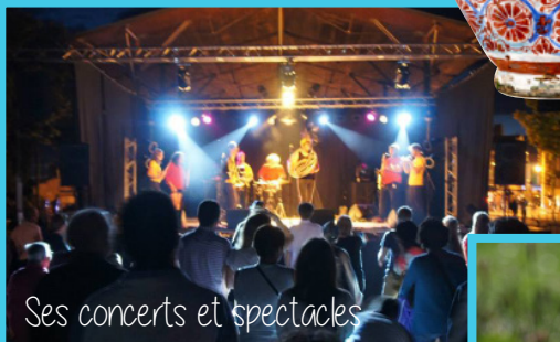
Ses concerts et spectacles