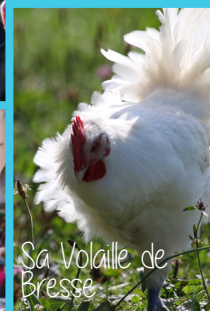
Sa Volaille de Bresse