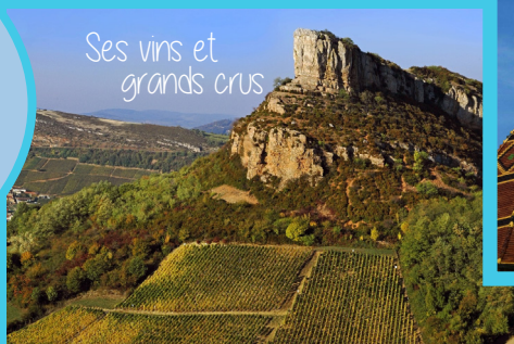
Ses vins et grands crus

Louhans-Châteaurenaud, la ville aux 157 arcades, est réputée pour sa volaille de Bresse, son marché du lundi matin, son Hôtel-Dieu et son Apothicairerie exceptionnelle, ses nombreux commerces et sa vie culturelle intense.