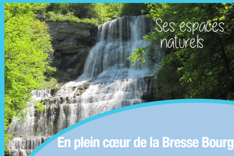
Ses espaces naturels