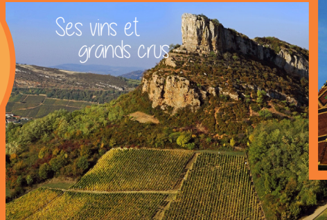
Ses vins et grands crus

En plein cœur de la Bresse Bourguignonne, la Bresse Louhannaise est reconnue notamment pour ses espaces naturels, sa forte culture gastronomique et son exceptionnel patrimoine architectural et historique. Louhans-Châteaurenaud, la ville aux 157 arcades, est réputée pour sa volaille de Bresse, son marché du lundi matin, son Hôtel-Dieu et son Apothicairerie exceptionnelle, ses nombreux commerces et sa vie culturelle intense.