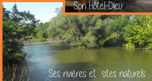
Ses rivières et sites naturels