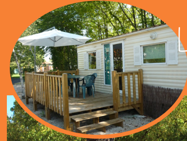
Les Trois Rivières