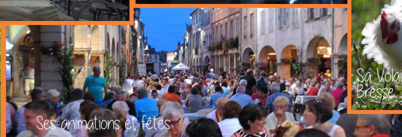
Ses animations et fêtes