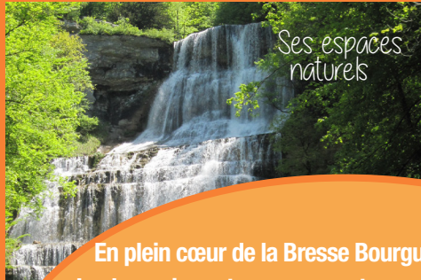
Ses espaces naturels