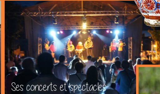
Ses concerts et spectacles