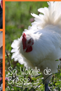
Sa Volaille de Bresse